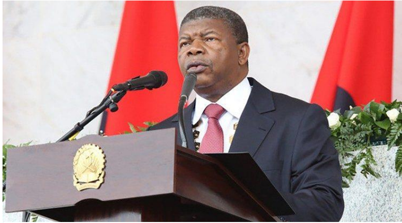
Tổng thống Angola, João Lourenço

Thỏa thuận bao gồm việc công nhận tính cách pháp lý của Giáo hội Công giáo ở Angola và quyền sở hữu các bất động sản, bao gồm các trường học và trung tâm y tế nằm rải rác trên cả nước.