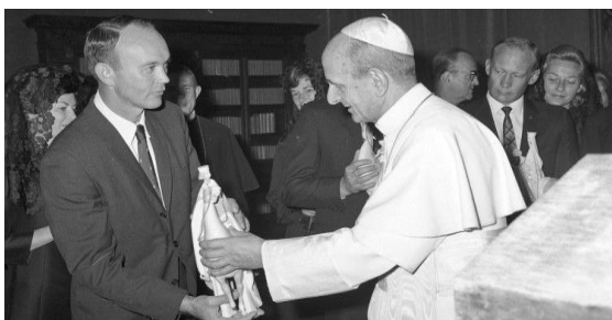
ĐGH Phaolô VI tiếp các phi hành gia tàu Apollo 11

Trước đó, với tư cách là một nguyên thủ quốc gia, ĐGH Phaolô VI đã được yêu cầu viết một "thông điệp thiện chí" để đưa vào một đĩa đặc biệt và được đem lên Mặt trăng bởi các phi hành gia Apollo 11. Thông điệp của ngài đã đến mặt trăng, được chờ đợi bởi cả phía khoa học lẫn tôn giáo, được trích từ Thánh vịnh 8: "Lạy Đức Chúa là Chúa chúng con, lấy lòng thay danh Chúa trên khắp cả địa cầu! Uy phong ngài vượt quá trời cao."