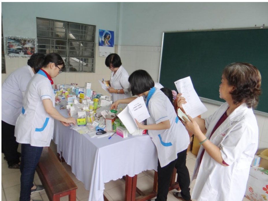
Nhóm Dược sĩ chuẩn bị thuốc cho các cháu

Sau khi khám bệnh xong, cả đoàn đã ngồi lại cùng với Ban Giám Hiệu trường để cùng lượng giá về tình hình chung sức khỏe của các học sinh, nhằm giúp chăm sóc cho các em cách tốt nhất.