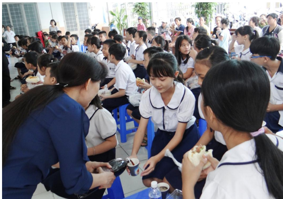
Các Doanh nhân chăm sóc bữa sáng cho các cháu

Chương trình nhằm nâng cao chất lượng cuộc sống, cải thiện sức khỏe cho người nghèo, người có hoàn cảnh khó khăn, qua đó thể hiện tinh thần truyền giáo trong phục vụ bác ái và yêu thương.