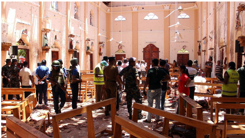
Quang cảnh kinh hoàng ngày Chúa Nhật Lễ Phục Sinh ở Sri Lanka

Tôi muốn thể hiện sự gằn gỏi triu mến của mình với cộng đồng Kitô giáo, bị ảnh hưởng khi đang họp nhau trong lời cầu nguyện, và cho tất cả các nạn nhân của bạo lực tàn bạo này. Tôi phó dâng cho Chúa tất cả những người đã thiệt mạng một cách bi thảm và tôi cầu nguyện cho những người bị thương và tất cả những người đau khổ vì sự kiện bi đát này.