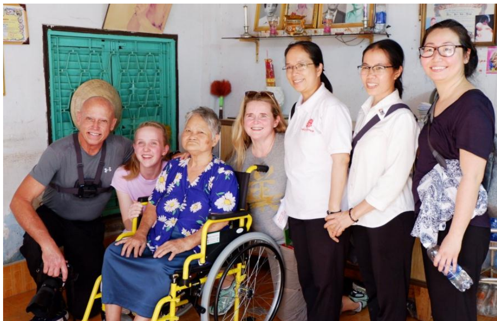
Đoàn đã đến thăm và trao xe lăn tại nhà các bệnh nhân

bệnh tật chuẩn bị nhận xe đã ngồi chờ sẵn từ sớm, mọi chuyện được diễn ra đúng theo chương trình. Ở đây đoàn AWM sắp xếp chia nhau hỗ trợ đưa từng người bệnh lên ngồi và nhận xe, kèm theo đó Caritas Sài Gòn cũng chuẩn bị cho mỗi trường hợp 10 kg gạo và cũng được trao tặng tại chỗ. Trước khi ra về Cha Giuse tặng cho đoàn 2 hộp bánh thay cho lời cảm ơn và cùng phái đoàn chụp chung một tấm hình.